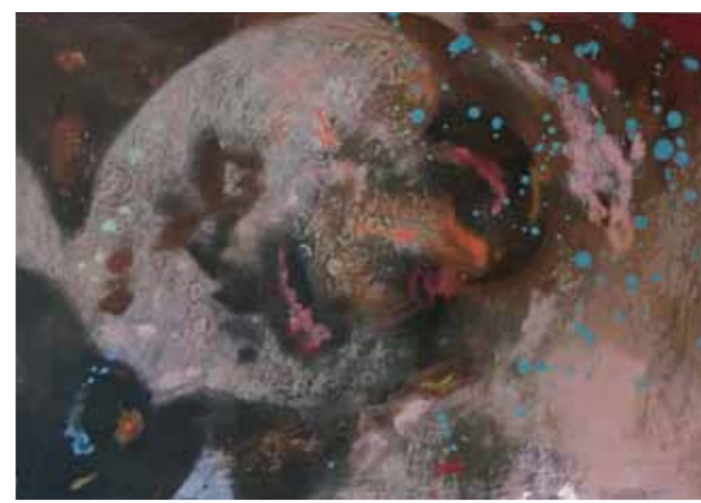
Ohne Titel 2011