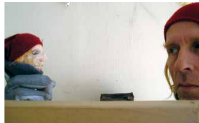
Der Strandkorb 2010